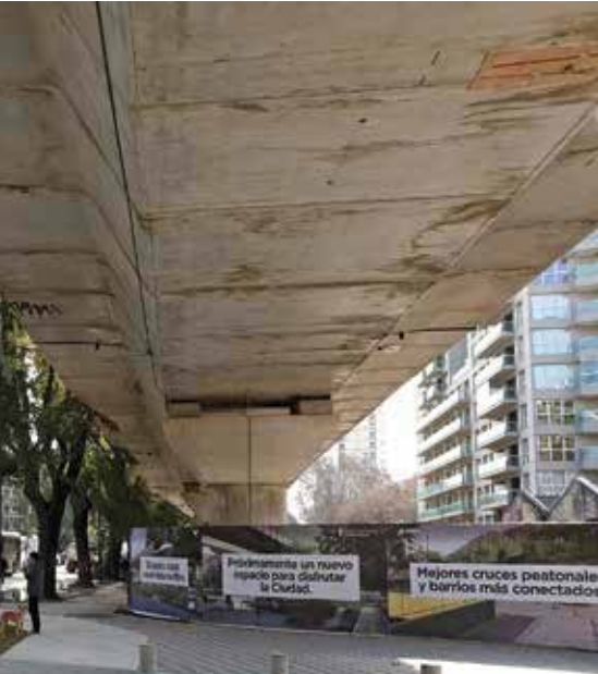
À gauche, Mexico, Metrobus. Ci-contre, Buenos Aires, création du viaduc ferroviaire