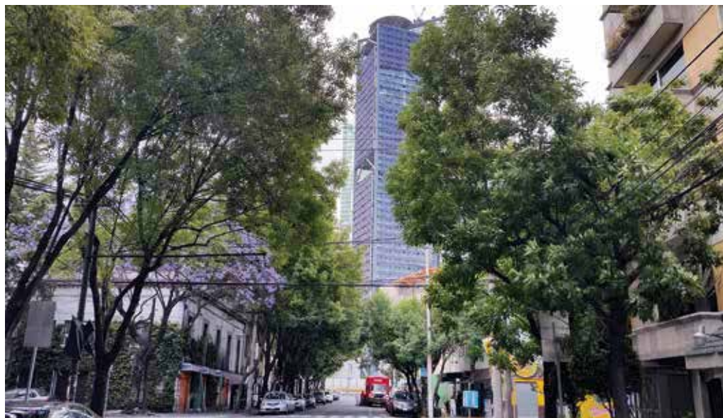
Ci-contre, Mexico, densification récente des quartiers centraux. À droite, Buenos Aires, espace public réalisé sur la couverture du Paseo del Bajo

Favorisés par des dispositifs d'encouragement à la densification des aires centrales, lesquelles concentrent la plupart des emplois qualifiés, d'autres opérations mixtes regroupant de l'habitat de standing, du tertiaire et des centres commerciaux reconquièrent progressivement des secteurs vétustes proches du centre. Tel est le cas du quartier construit autour du musée Soumaya, ouvert en 2011 pour